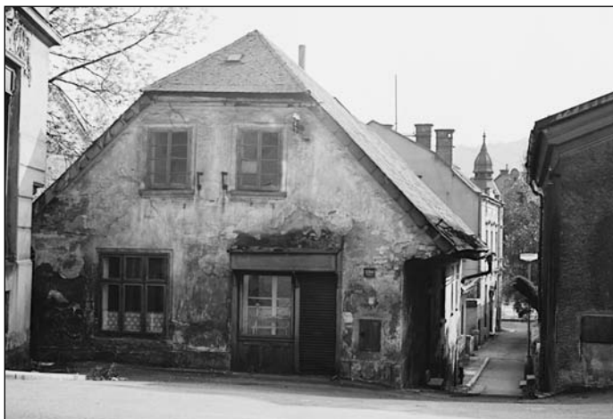
Foto č. 1. Dům čp. 250 na křižovatce ulic Husova a Pivovarská.