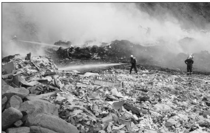
Požár skládky v Košťálově.

Hasičský záchranný sbor Libereckého kraje – územní odbor Semily (HZS LK – ÚO Semily) eviduje na území okresu Semily za uplynulý loňský rok 646 událostí, což je o 363 zásahů méně než v roce 2007. Největší měrou se na tomto počtu podílely zásahy u silničních nehod, kterých bylo 228 (35,29 %). Následují zásahy při technické pomoci v 166 případech (25,69 %), 125 požárů, u kterých jednotky PO zasahovaly ve 120 případech (19,35 %), dále 71 zásahů u větrné smršti (10,99 %). Z ostatních evidovaných událostí s účastí jednotky PO můžeme jmenovat 15 zásahů (2,32 %) při úniku nebezpečných chemických látek, 5 zásahů (0,77 %) v důsledku železničních dopravních nehod a 1 zásah (0,15 %) při letecké nehodě. V neposlední řadě se jednalo o 30 planých poplachů (4,64 %). Pokles událostí oproti roku 2007, byl zapříčiněn tím, že v uplynulém roce jednotky PO nelikvidovaly žádnou událost v důsledku velkého spadu sněhu (oproti 99 událostem v roce 2007) a dále že jednotky PO likvidovaly o 117 méně událostí typu větrná smršť.