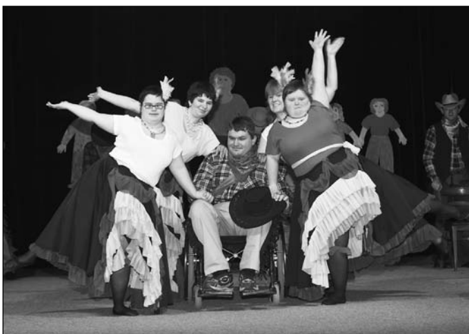
Klienti Denního stacionáře v Lounech při svém vystoupení pod názvem PIF PAF, kterým se představili na loňském ročníku festivalu Patříme k sobě.

V minulých Semilských novinách jste se dozvěděli o zavrženíhodném činu neznámého zloděje, který odcizil pokladničku veřejné sbírky Pozvedněte slabé, jejíž výtěžek měl směřovat k účastníkům letošního festivalu Patříme k sobě, kterého se účastní děti, mládež i dospělí lidé se zdravotním postižením.