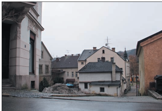
Foto č. 2. Křižovatka ulic Husova a Pivovarská dnes.