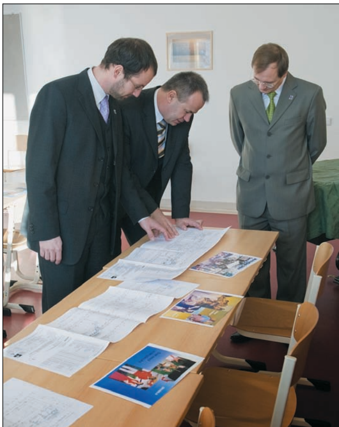
Během návštěvy waldorfského lycea si hejtman se zájmem prohlédl projekt rekonstrukce objektu školy.

Na pozvání starosty města Semily Jana Farského navštívili Semily dne 9. ledna 2009 hejtman Stanislav Eichler, náměstek hejtmána pro školství Radek Cíkl a radní pro zemědělství a životní prostředí Jaroslav Podzimek.