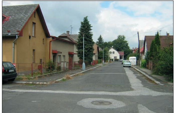
Městská část Kruha je jednou z lokalit, kde budou práce zahájeny již letos.

Celkově se rekonstrukce stávající kanalizace dotkne asi 153 přípojek (zhruba 600 obyvatel), nových přípojek vznikne 187 (přibližně 959 lidí).