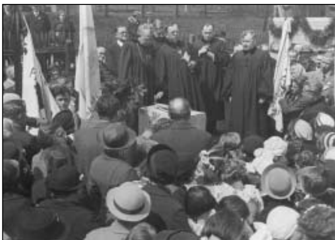
Slavnost položení základního kamene ke sboru 8. května 1938. Zcela vpravo v černém taláru biskup S. Kordule.

Otevření sboru bylo zamýšleno jako oslava dvacetiletí samostatné republiky. Během stavby se rychle