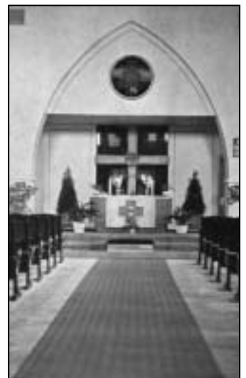
Výzdobu kněžiště provedla sklářská škola v Železném Brodě.